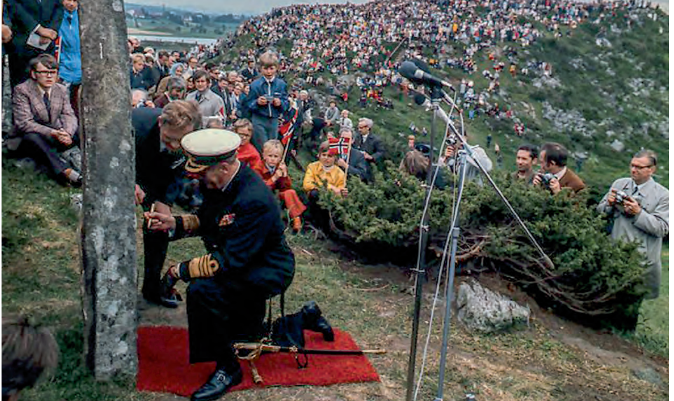
Bilde av Kong Olav 5 som signerer bautasteinen på Ytraberget er tatt av Knut S. Vindfallet.

I fjor ble 1150-årsjubileet for slaget i Hafrsfjord markert med arrangementer både nord og sør i Rogaland. Slik var det også i 1972 da man markerte 1100-årsjubileet for slaget. Mediedekningen vitner om stort folkelig engasjement også den gangen, men ellers var ganske mye annerledes den gangen.